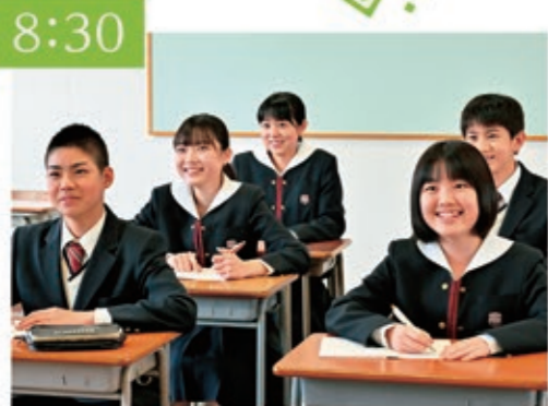
SHR 8:30~8:45までの ショートホームルーム。