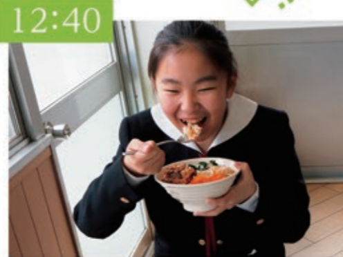
昼食 お弁当を教室で食べます。 食堂も利用できます。