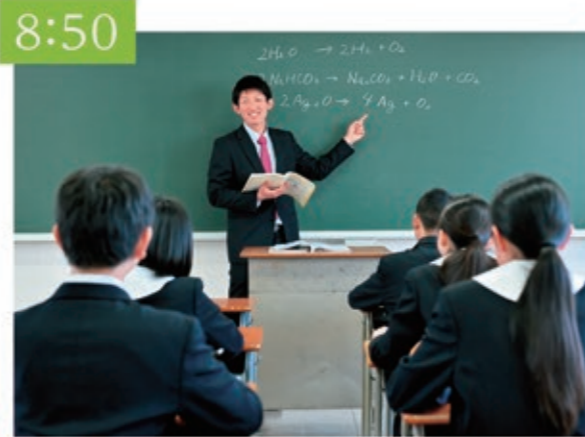
授業 午前の授業スタート! 集中しているとあっという間に次の授業。