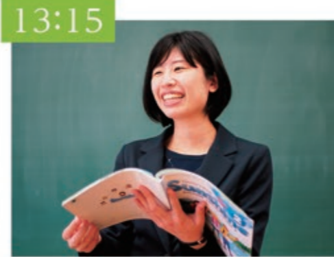
授業 午後の授業スタート!