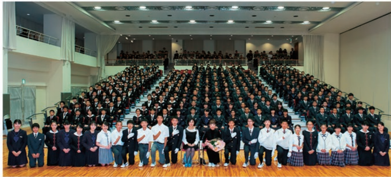
コシヒロコ氏講演会