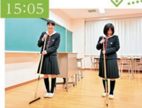
清掃・終礼 7限目の前に、 清掃・終礼をします。