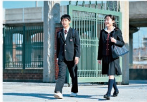
登校 自転車、電車、スクールバスなどで登校しています。