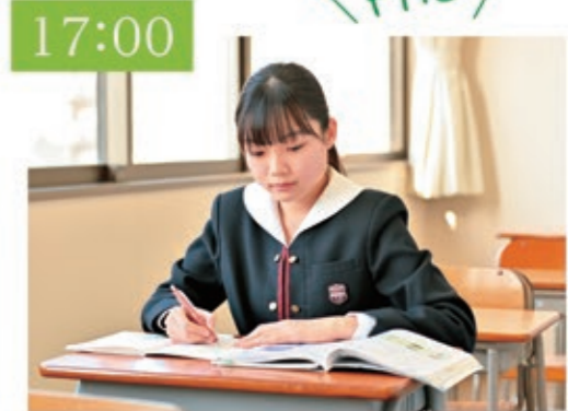
放課後 放課後は部活動をしたり、FASで自分のしたい勉強をしたりしてから下校します。