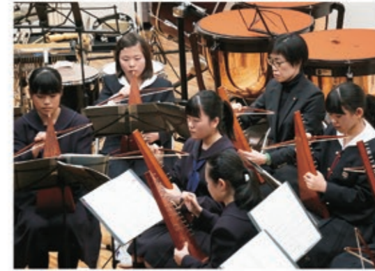
コンサート(ブサルター)